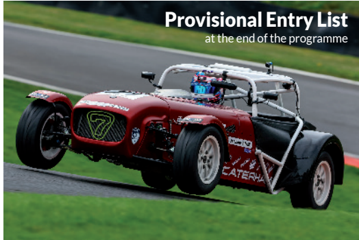
Provisional Entry List at the end of the programme