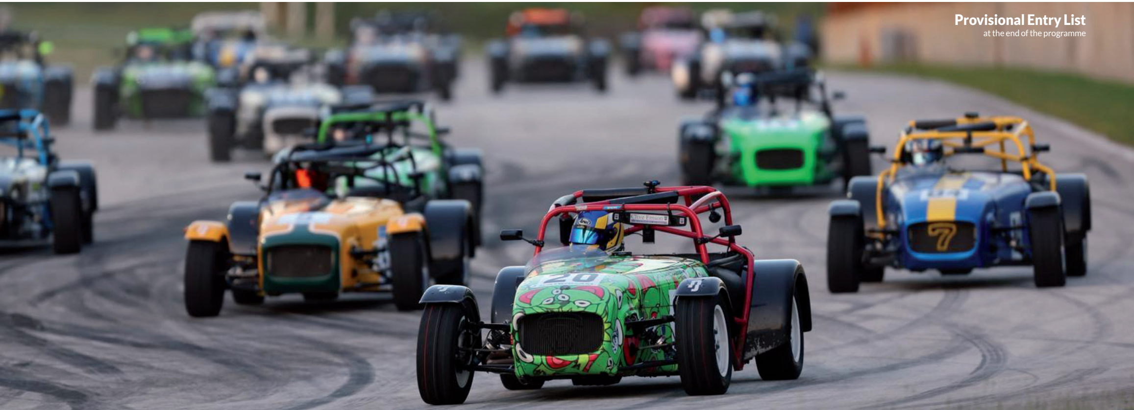
Provisional Entry List at the end of the programme