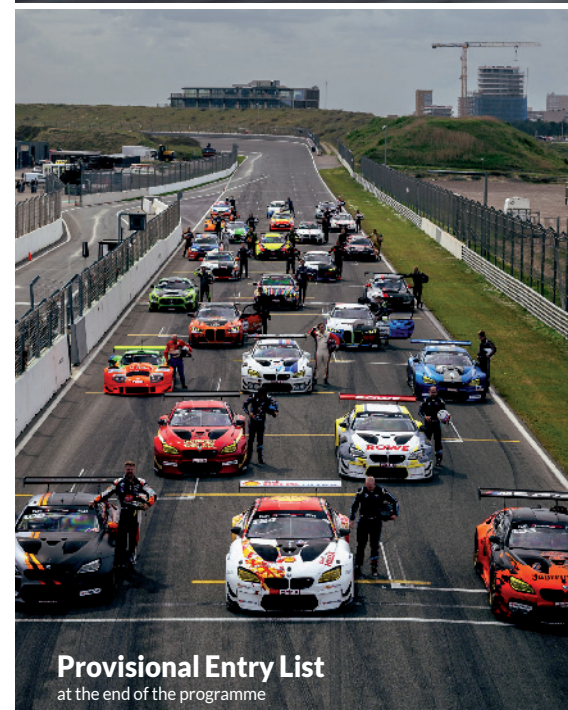
Provisional Entry List at the end of the programme