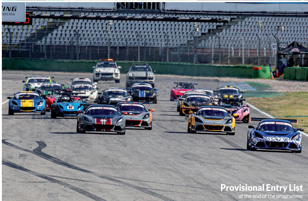
Provisional Entry List at the end of the programme